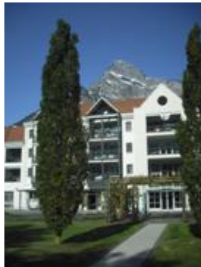
Alterszentrum Castelsriet Sargans